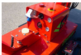
Unité centrale regroupant les fonctions d'aspiration